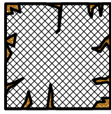
Doorsnede kop met soft-rot / beschadiging

Afhankelijk van de aantasting wordt de aantasting plaatselijk of in een groter geheel hersteld