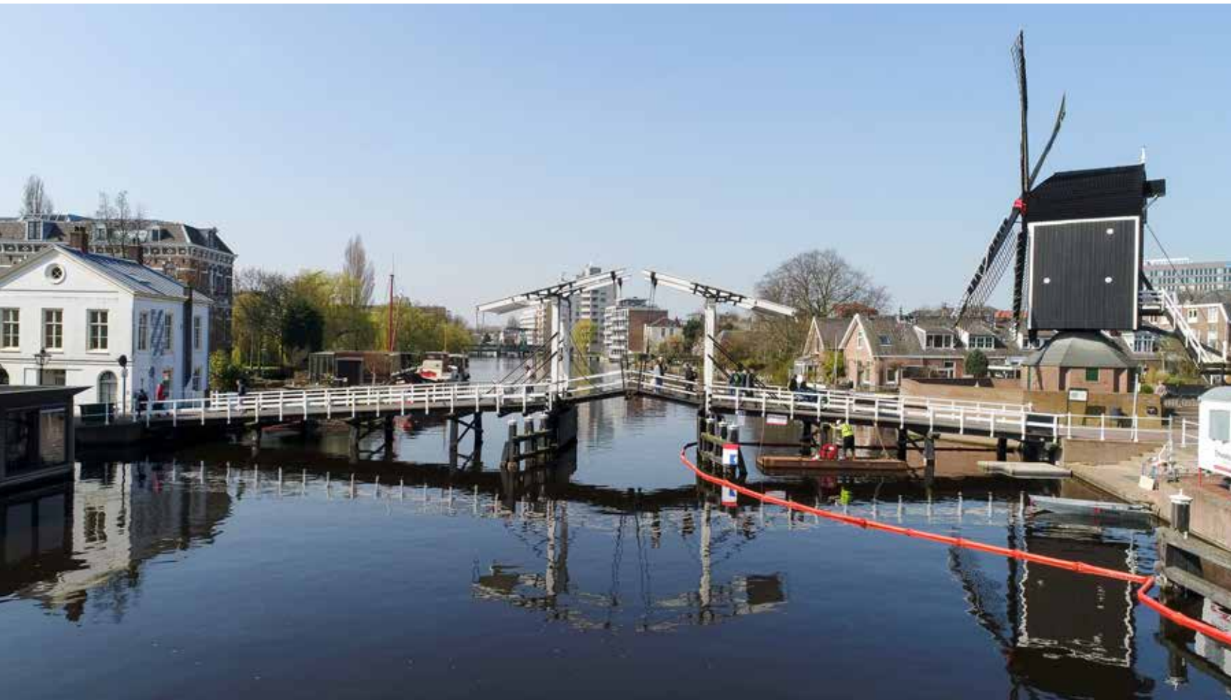
Restauratie Rembrandtbrug Leiden

Nederland en water; twee elementen die onlosmakelijk met elkaar zijn verbonden. We beschermen onszelf tegen het water door het bouwen van dijken, bruggen en sluisen. We profiteren van het water met onze havens, rivieren en kanalen. Om dit te kunnen blijven doen in de toekomst, hebben veel kunstwerken in de waterbouw een grondige opknappbeurt nodig. Ondanks dat de kunstwerken vaak gedeeltelijk aangetast zijn kiezen nog steeds veel gemeenten, provincies en waterschappen voor vernieuwing van houten kunstwerken in plaats van herstel. Dit kost niet alleen veel geld, maar zorgt ook voor een hoge CO 2 -uitstoot en verspilling van tropisch hardhout.